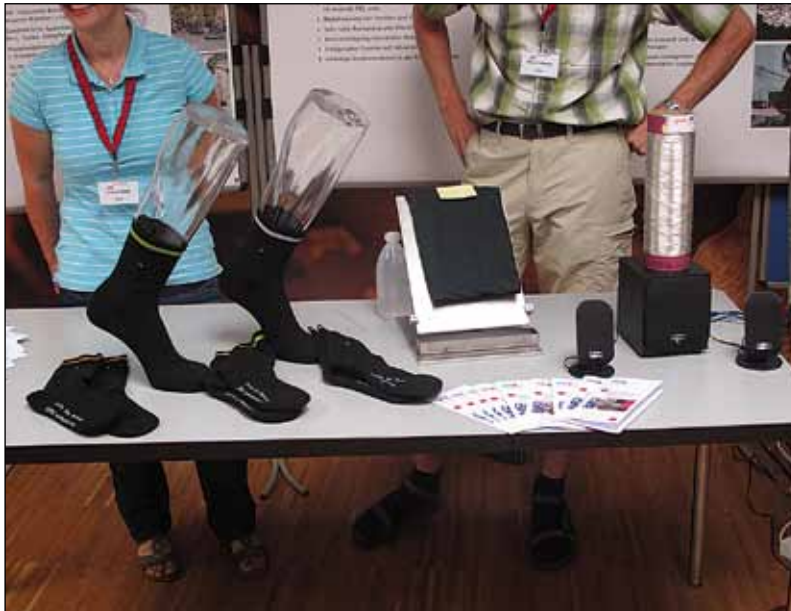
Auch die neuen Armeesocken, ein Projekt von armasuisse und Empa, waren vertreten

Schweizerische Vereinigung Textil und Chemie