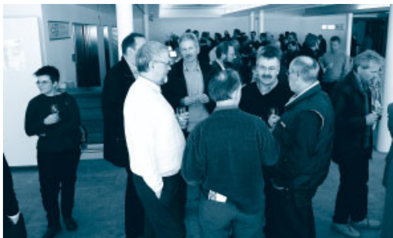
Abb. 3: Apéro

So gestärkt und kulinarisch erfreut begaben sich die etwa 90 Personen zur Vorführung des Filmes „Bau der Schwebebahn“, der im Jahre 1935 als Stummfilm gedreht wurde. Nach dieser Einführung in die Geschichte erlebten die SVTC-Mitglieder einen vertieften Einblick in die Technik auf 2500 Meter Höhe. Unter kundiger Führung durch die Herren Broger und Fitzi von der Säntis-Schwebebahn AG