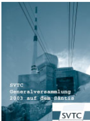
Abb. 1: Zur 8. Ordentlichen Generalversammlung der SVTC 2003 auf dem Säntis trafen sich etwa 90 Mitglieder auf dem Hausberg der Ostschweiz.

Die diesjährige GV war ein ganz besonderer Anlass. Bei schönstem Wetter trafen sich etwa 90 Mitglieder auf dem Säntis, dem Hausberg der Ostschweiz (Abb. 1). Bereits am frühen Vormittag waren die ersten mit der Seilbahn unterwegs auf den Säntisgipfel und genossen dort auf den verschiedenen Terrassen die wunderbare und klare Aussicht ins Appenzellerland, die Vorarlberger und Bündner Alpen, das Toggenburg und in die Innerschweiz (Abb. 2). Nach der vom SVTC gesponserten Gratisfahrt auf den Gipfel waren die Mitglieder zu Kaffee und Gipfeli eingeladen, eine von der Firma Ciba Spezialitätenchemie offerierte Begrüssungsgabe.