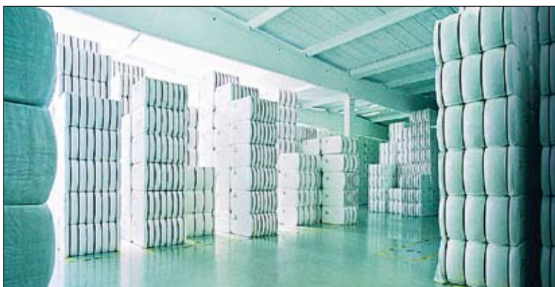
RZ-Ballenlager bei der Firma LENZING AG