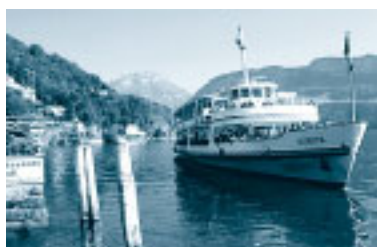
Abb. 3: Mit der „Europa“ zurück nach Luzern

Der Apéro am reservierten Tisch – in verdankenswerterweise von der SVTC gestiftet – bot die erste Gelegenheit, miteinander in der Vergangenheit zu stöbern, sich gegenseitig nach den Kollegen von damals und den Mit-Senioren von heute zu erkundigen oder die eine oder andere berufliche Reminiscenz aufleben zu lassen. Nicht weniger zur Diskussion standen aber auch die aktuellen Themen aus (Sozial-) Politik und Wirtschaft. Die Gespräche, so fiel dem Beobachter auf, waren gar so intensiv, dass die Bewunderung für Landschaft und See rings ums Schiff fast ein wenig zu kurz zu kommen schien. Und noch etwas wurde sichtbar: Hier hatten sich Kollegen (mit Dame) zusammengefunden, die sich schlicht und einfach freuten, wieder einmal einander zu treffen!