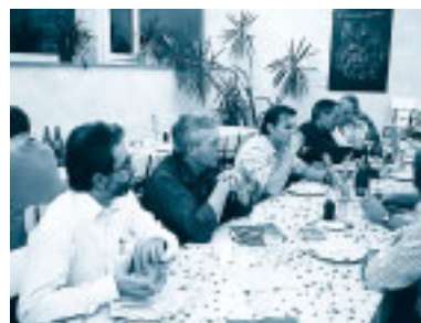
Abb. 2: Vor und nach dem „Hammen“ gab es eine Menge Informationen

geselligen Abend einlädt. Bei den zirka 20 Teilnehmern konnten auch Pensionierte begrüsst werden, die auch immer wieder von alten Zeiten zu berichten wussten und sich natürlich auch mit neusten Informationen eindecken konnten. Der gewohnt saftige „Hammen“, der bereits Stunden