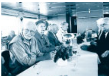
Abb. 2: Erste Gespräche beim Apéro auf dem Schiff

Nehmen Sie, liebe Leserin, lieber Leser, die schönste Ansichtskarte hervor, die Sie diesen Sommer erhalten haben. Was Sie sehen, ist ein unge- trübt azurblauer Himmel und eine überaus freundliche Sonne, in der Bildmitte ein tannengrün schimmern-