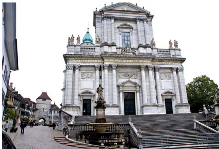
Die St. Ursen-Kathedrale, erbaut 1762 bis 1773