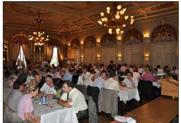
Das gemeinsame Nachtessen der Mitglieder von SVTC und SVT mit intensiven Diskussionen und vielen lustigen Anekdoten.