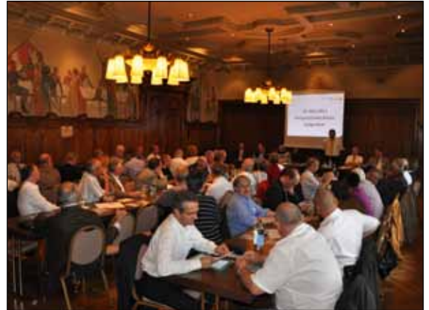
Interessierte Mitglieder an der SVTC-Generalversammlung

nicht immer sorgenfreien Zukunftsaussichten kommuniziert und teilweise diskutiert.